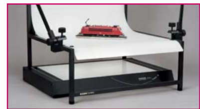
Kaiser Flächenlichtquelle zur Durchleuchtung oder zum Freistellen. backlite 6000 (5463) für Art.-Nr. 5928/29 prolite basic 2 HF (2425) für Art.-Nr. 5997/98

Alle Komponenten gibt es übrigens auch einzeln.